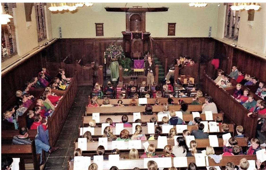
Het interieur van de kerk uit 1917.

Daarna werd ingegaan op de geschiedenis van de oude kerk en de brand waarvan gemeld werd: "Hoewel de oorzaak onbekend bleef, is het vuur waarschijnlijk door de kachels aangekomen. De meeste inwoners van deze plaats betreuen nog altijd den ondergang van het oude kerkje met zijn eleganten gevel en aardigen toren."