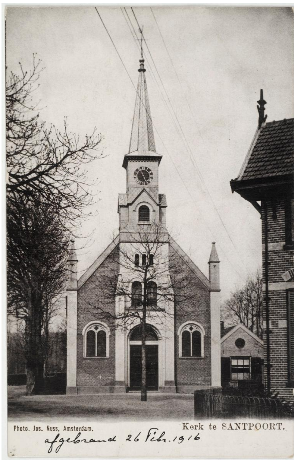
De kerk van 1844.