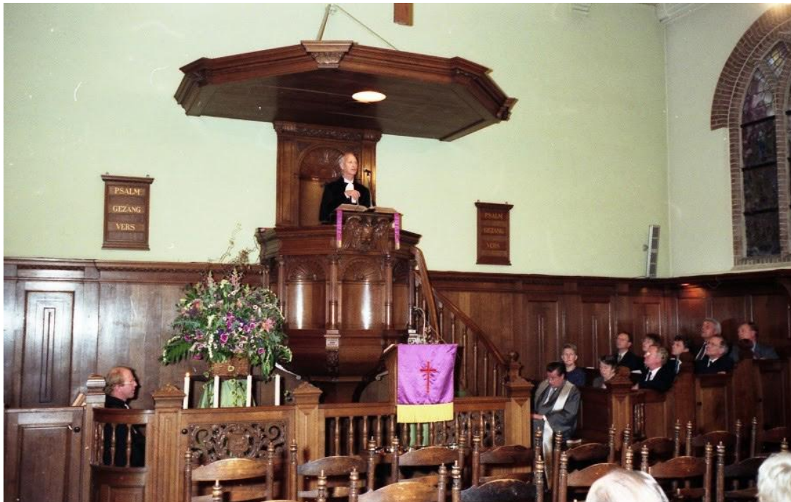
Interieur met het doophek en de preekstoel uit 1917.

schilden en werd in Slavonisch eikenhout uitgevoerd in overeenstemming met de meubels in de kerk. De speeltafel kwam geheel vrij voor het front te staan. Dit heeft in vergelijking met het oude systeem het voordeel dat de organist zijn orgel het zelfde hoort als de gemeente in de kerk. Bij het oude systeem was de speeltafel aan de zijkant van het orgel aangebracht. Het orgel had twee klavieren en pedaal en heeft een elektrische windmachine. De registers en andere zaken in het orgel werden uitgebreid beschreven.