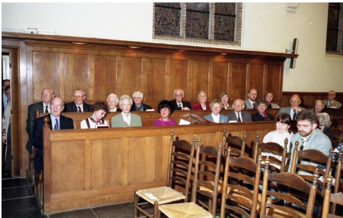
De kerkbanken aan de zijkant uit 1917.