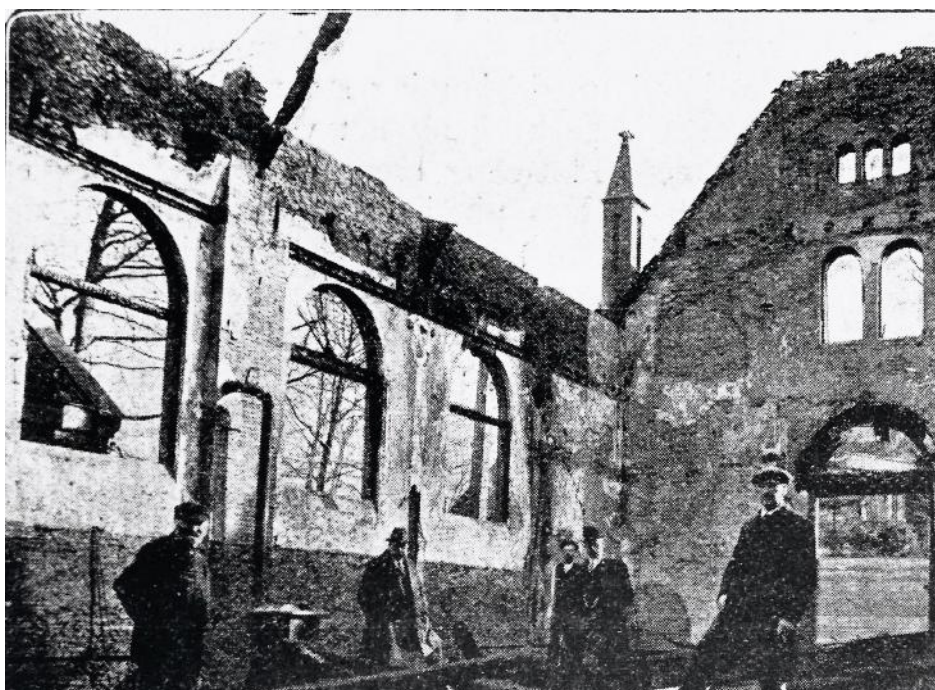
De afgebrande kerk.